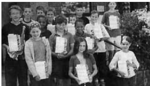
Le savoir, dans les mains

Un dictionnaire pour l'entrée au collège.