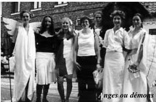
Anges ou démons

Une braderie haute en couleurs sous le ciel bleu de Bachy. Autant de monde sur les trottoirs que sur le pavé... C'est l'occasion de faire de bonnes affaires et surtout de se rencontrer entre voisins, amis ... C'est la seule journée annuelle où tous les