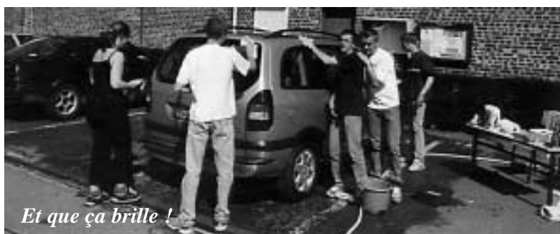
Et que ça brille !

22 Mars – Les jeunes de la commune se sont retroussés les manches pour effectuer un lavage de voitures afin de financer une partie de leur séjour à la montagne.