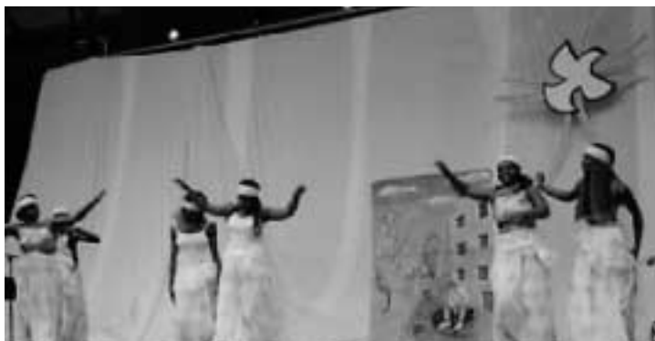
Ballet animé par la troupe "Messa"

17 Mai : Dans la salle des fêtes, l'association "Contribution au Développement du Togo" a organisé une excellente soirée de dépaysement : un ballet de danse, de nombreuses spécialités de repas africain suivis par une soirée dansante. Cette soirée a été appréciée par les très nombreux participants.