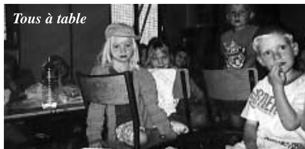
Tous à table