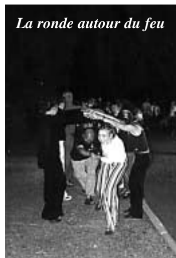
La ronde autour du feu

Grâce aux jeunes et à un équipement sophistiqué pour le son, l'éclairage et l'animation, cette fête préfigure à quelques jours près le début des Vacances d'été. L'occasion de laisser libre cours à sa joie, à la fête et à l'enthousiasme de tous, jeunes et moins jeunes. Chacun s'en est retourné tard dans la nuit après avoir tourbillonné autour du feu de la St Jean. C'était la nuit la plus chaude de Bachy !