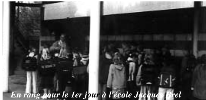
En rang pour le 1er jour à l'école Jacques Brel