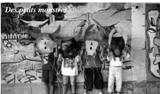
Des petits monstres