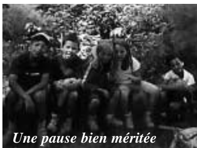
Une pause bien méritée

Une petite troupe d'acteurs en herbe, sur scène à la plus grande joie des parents et des amis venus nombreux les encourager. On n'avait jamais vu autant de photographes dans la salle, soucieux de garder en souvenir les bons moments de cette soirée faisant suite aux nombreuses animations du CLSH.