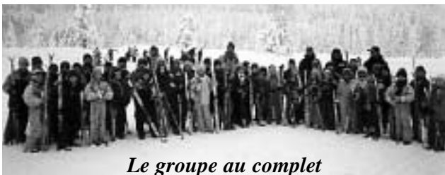
Le groupe au complet

d'une journée pour cause d'intempéries, ils garderont un merveilleux souvenir de leur séjour.