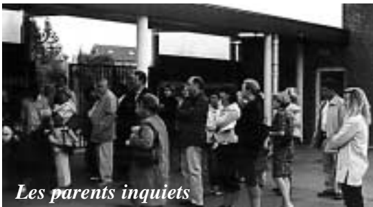
Les parents inquiets