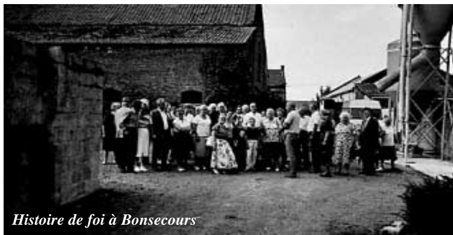
Histoire de foi à Bonsecours

Les pèlerins ont assisté à l'office de la Basilique de Bonsecours, suivi d'un repas convivial. Dans l'après-midi ils ont visité un élevage, spécialisé dans le gavage de volailles.