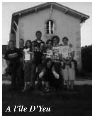
A l'île D'Yeu