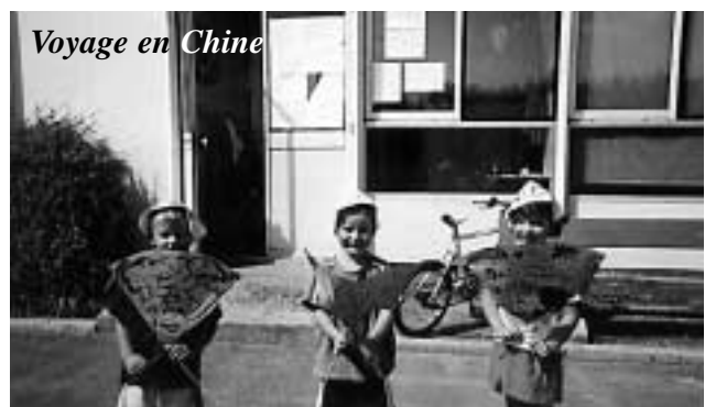
Voyage en Chine

29 juillet : Ouverture du centre aéré intercommunal, basé cette année à Bourghelles. De 35 à 48 jeunes, selon les semaines, ont participé aux nombreuses activités.