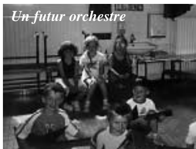
Un futur orchestre