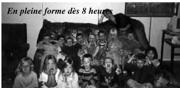
En pleine forme dès 8 heures