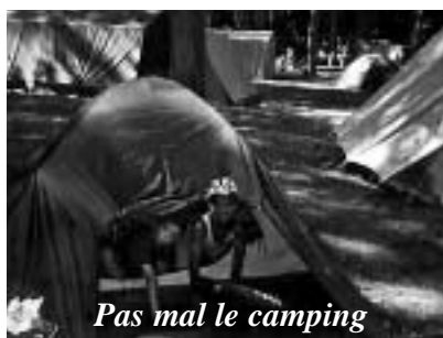
Pas mal le camping