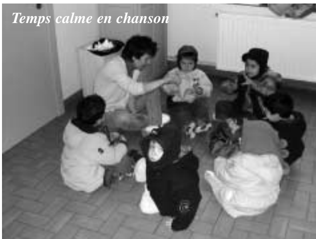
Temps calme en chanson