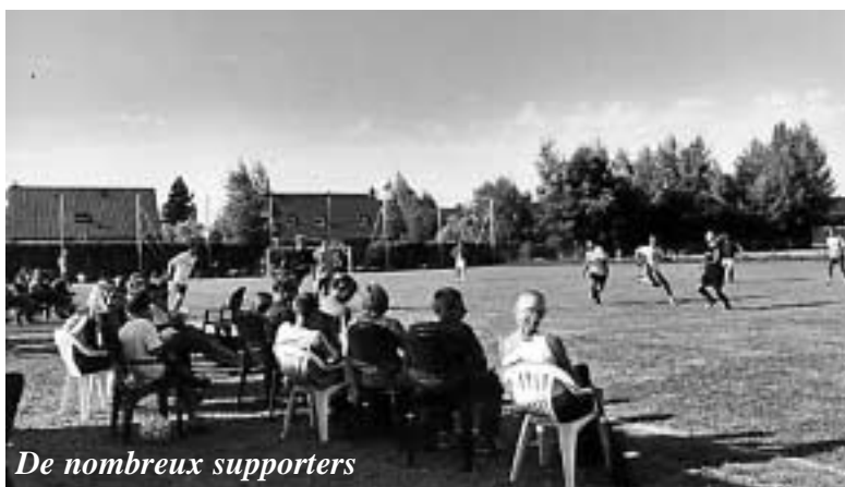
De nombreux supporters

Tournoi de foot du club des jeunes : le cinquième du nom et toujours autant de succès. Cinq équipes rivalisaient au stade municipal par ce bel après midi d'été.