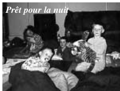
Prêt pour la nuit