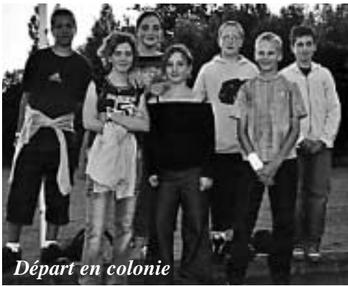
Départ en colonie