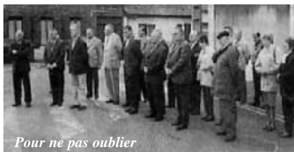
Pour ne pas oublier

Dimanche 27 avril , les anciens combattants ont effectué un dépôt de gerbes au pied du monument aux morts, en commémoration de la journée nationale du souvenir des victimes et héros de la Déportation.