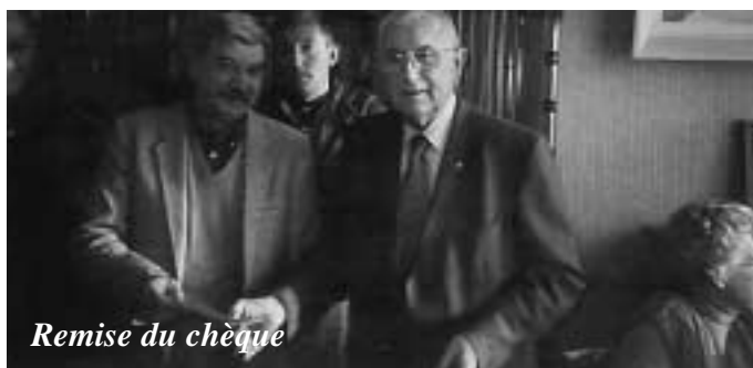
Remise du chèque