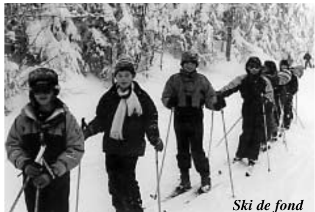
Ski de fond